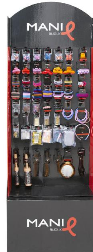
Expo in cartone