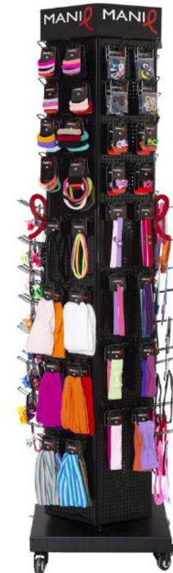
Tower in metallo